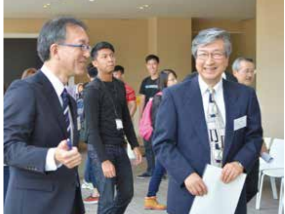
シンガポールの学生を迎えて(細井副学長[右])