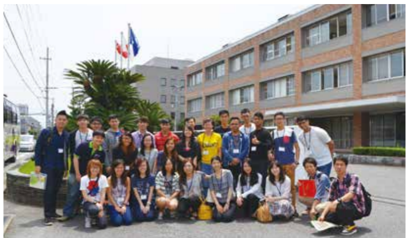
日本人学生も大活躍の国際交流イベント