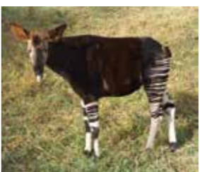
オカピ。19世紀に発見され、コンゴ民主共和国にしか見つかっていない動物

を習得することに関して真実です。英語力は文化の違いを遣り繰りし、国際社会で成功を収める為の鍵となる技量の一つです。自分を信じ、そして貴方の努力をポジティブな方向に考えなさい。負の感情は失敗につながるからです。素晴らしい医学の専門家になって成功を収めることを期待しています。