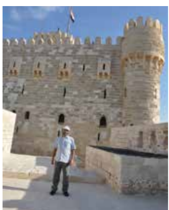
エジプト: カイト・ベイの要塞

な人間関係を通じて、学生たちは卒業までの期間、専攻の学問を追究するだけではなく、社会人となるための素地を養い、社会生活の基盤を確立していくという点で、専門分野の学問研究に集中する各国の大学機関とは、大学教育の果たす役割が大きく異なることでし