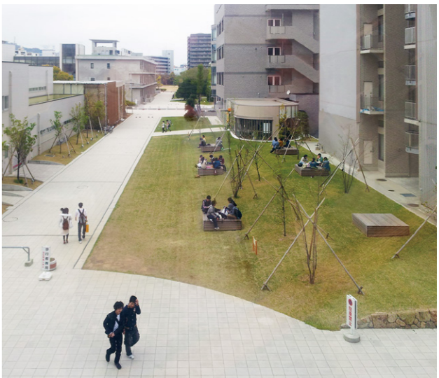
現在の敷地の様子