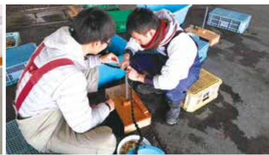
ワカメ養殖の作業中

学生時代は、趣味にアルバイト にサークルに、とにかく多方面の 活動に取り組みました。遊んでい ただけだろうという声もありませ が（笑）。面白そうなことには何 んでも手を出していたので、体が 一つでは足りなくなりました。でも、その活動を通して多くの人