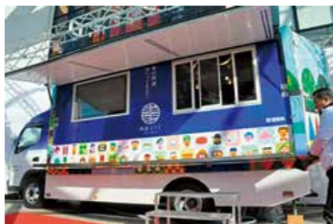
運営を任されている「でりばりキッチン阿波ふうど号」

大学のカリキュラムでは、一次産業について広く勉強しました。また、それらをどのようにビジネ