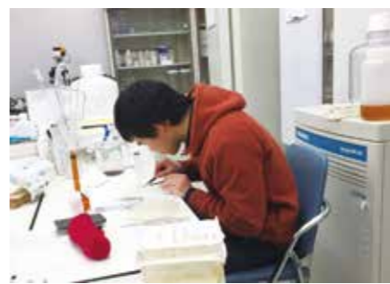
研究室での実験の様子

スに発展させるかという考え方に ついても学びました。中でも特に 大切にしていたのは、生産の現場 を見て、体験して、そこで働く人 の声を聞くことです。インターン シップは、農業法人に2シーズン 行きましたし、研究室を選んだの も、コースの中で一番現場を見る 機会が多いと考えたからです。 水産研究室から農業職に就いた ことで、驚かれることも多くあり ました。でも無理なことではあり ません。本学は、4年間を通して 広く学ぶことができるので、専 攻の分野が違って、ゼロからの スタートにはならないからです。 基本になることを学んでいるの で、スムーズに勉強を進めること ができました。水産も分かる農業 職員ということで「水陸両用」と 言われたこともありです。