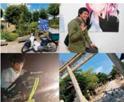
趣味に動しむ毎日

学生時代は、趣味にアルバイト にサークルに、とにかく多方面の 活動に取り組みました。遊んでい ただけだろうという声もありませ が（笑）。面白そうなことには何 んでも手を出していたので、体が 一つでは足りなくなりました。でも、その活動を通して多くの人